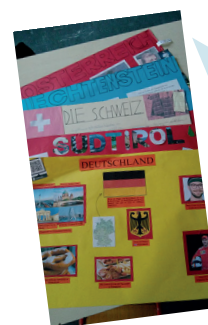
Exposition sur les pays de langue allemande (CM2-6e)