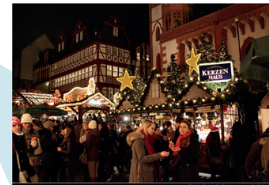
Jeu de rôle : au marché de Noël